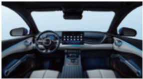
Azul y gris