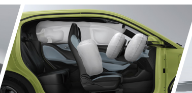
Equipado con 6 Bolsas de Aire