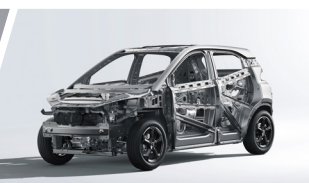
Estructura Corporal de Alta Resistencia