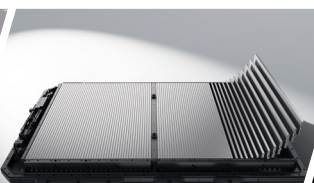
Ultra-Safe Batería Blade