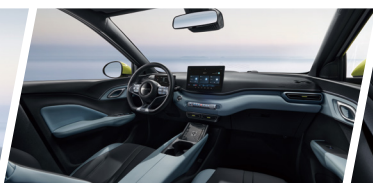
Cabina Ocean Chic