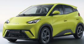
380KM NEDC de Autonomía