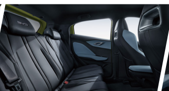
Espacio Interior Optimizado