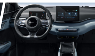
Sistema de Cabina Inteligente BYD